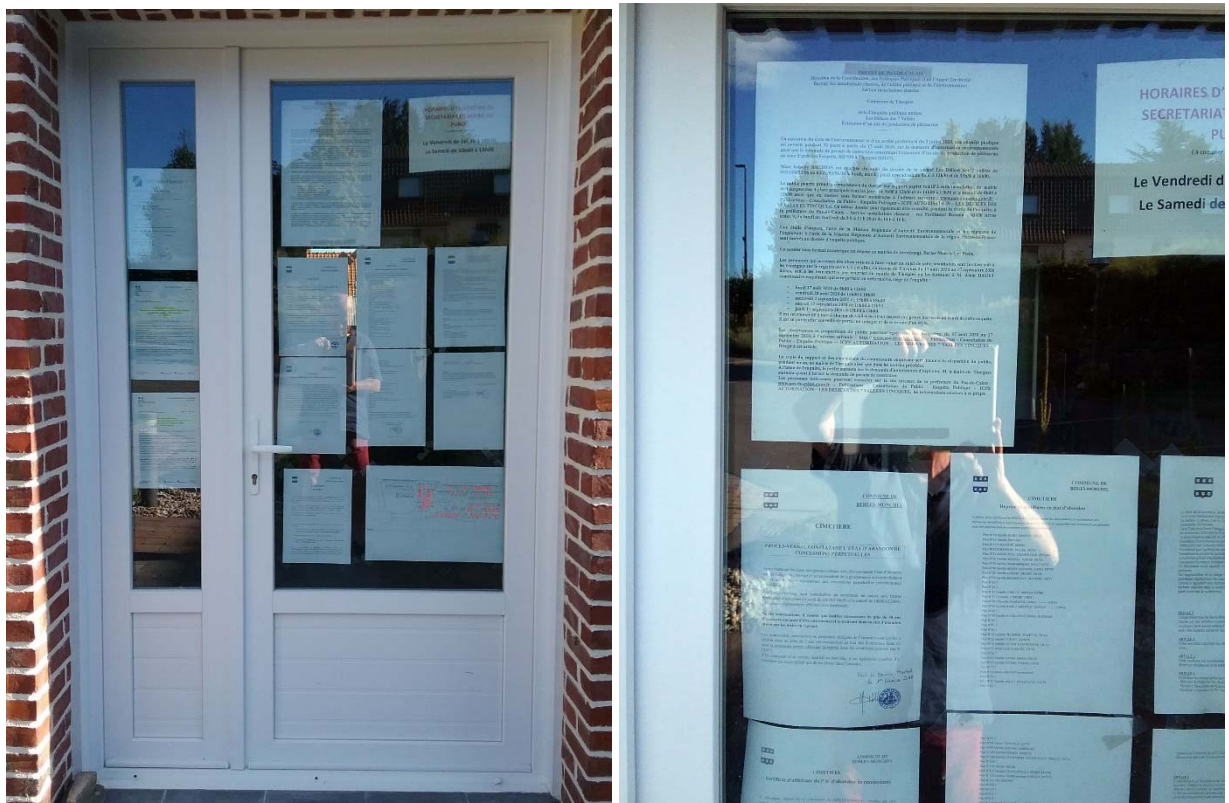
Affichage de l’avis d’enquête publique, sur papier blanc format A3 , sur la porte de la mairie (pas d’arrêté préfectoral).